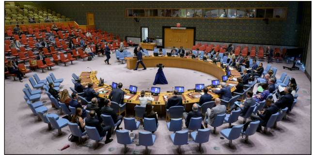
Seules les sanctions du Conseil de sécurité de l'ONU peuvent prétendre à une validité et à une adhésion universelles.

Il convient tout d'abord de se demander à quoi servent les sanctions. Pour celles de l'ONU, c'est clair: les sanctions économiques visent à punir un pays qui ne respecte pas les règles de l'ordre de paix de l'ONU. Elles ont pour but d'amener le pays sanctionné à renoncer à de nouvelles violations du droit international, par exemple au recours à la force ou à la menace de la force contre un autre pays, ou à une politique qui viole les droits de l'homme ou favorise le terrorisme.